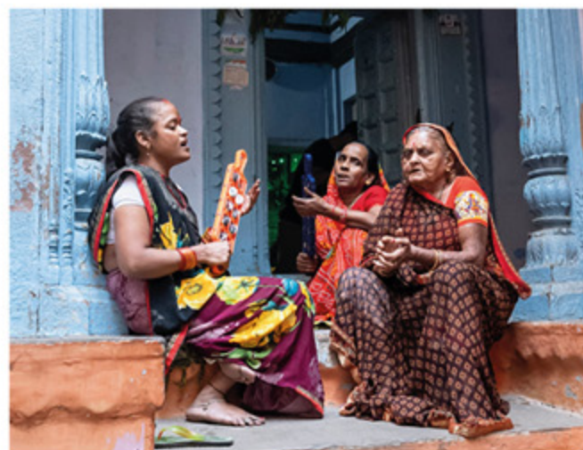
Sopra foto di Alessandro Raschilla: "Varanasi" In copertina: "apertura orfanotrofo Diocesi di Kumbakonam".