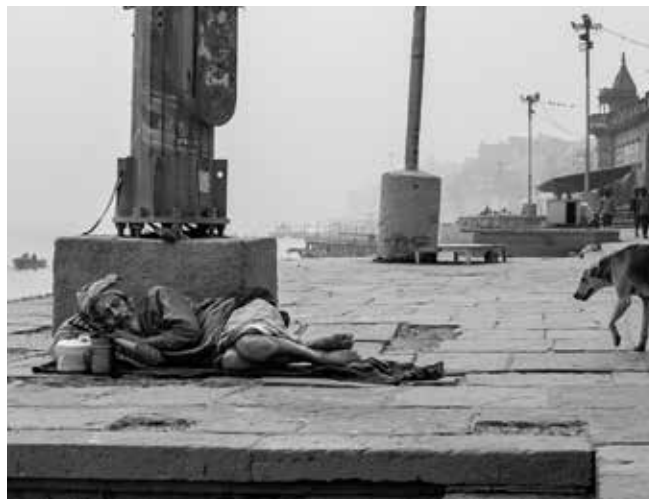
Varanasi di Alessandro Raschilla